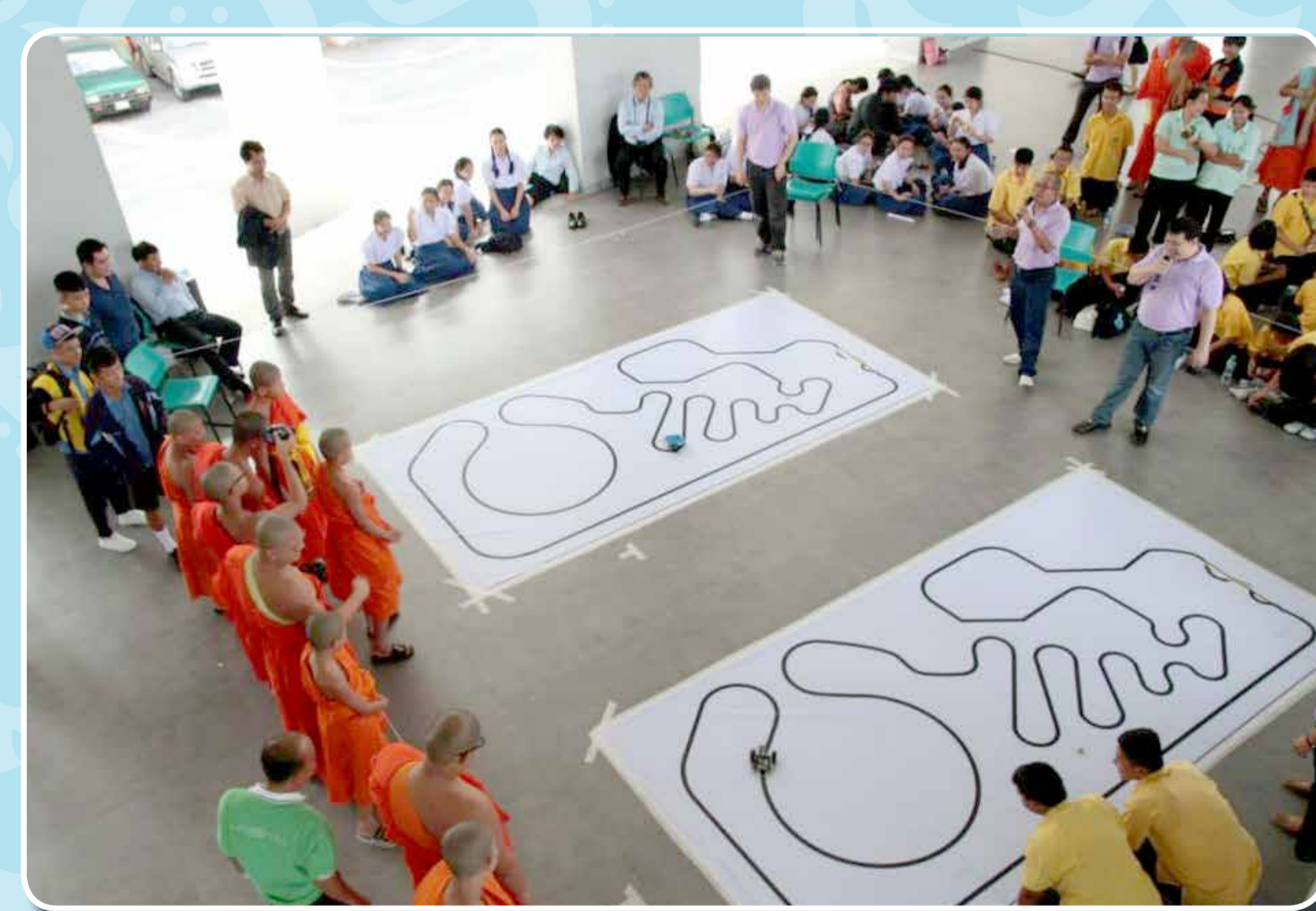
กิจกรรมหุ่นยนต์ BEAM วิ่งตามเส้น เดือนมิถุนายน 2557 ณ สถาบันการจัดการปัญญาภิวัฒน์