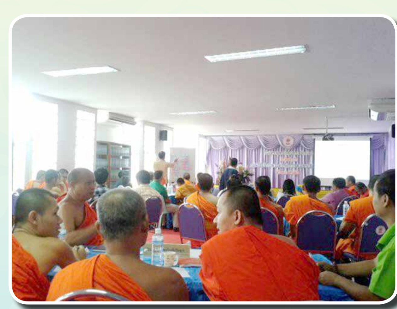
อบรมเชิงปฏิบัติการและศึกษาดูงาน