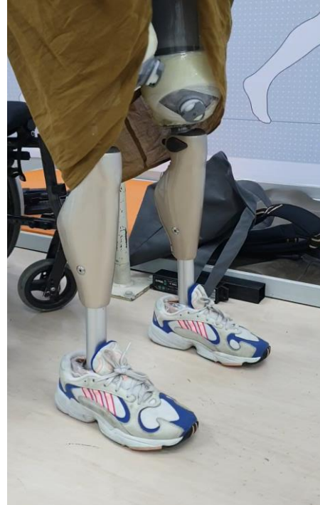
วิดีโอขณะฝึกใช้ฟังก์ชัน ล็อกข้อเข่าในทางอ