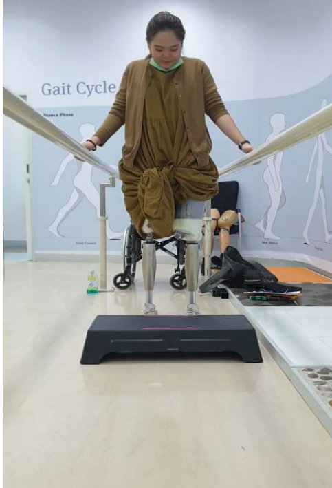
วิดีโอขณะฝึกการก้าวลงพื้น ต่างระดับโดยใช้ฟังก์ชันข้อเข่า