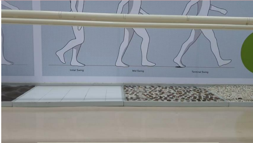
วิดีโอขณะฝึกเดินบนพื้นระนาบ