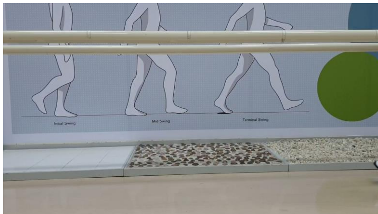
วิดีโอขณะฝึกเดินบนพื้นระนาบ