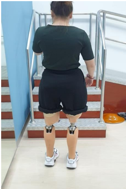
วิดีโอขณะฝึกขึ้น - ลงบันได