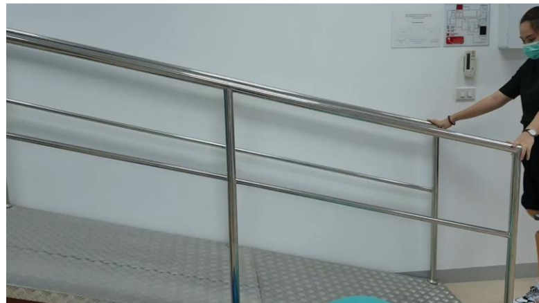
วิดีโอขณะเดินขึ้น - ลงทางลาด

ผล: นางสาวณิชชารีย์ได้ฝึกทดลองการใช้ขาเทียมคู่ใหม่ และสามารถกลับไปใช้งานในชีวิตประจำวันได้เป็นอย่างดี ซึ่งนางสาวณิชชารีย์รายงานว่า สวมใส่แล้วรู้สึกดีมาก ไม่รู้สึกปวดตรงบาดแผลเดิมแล้วและควบคุมการเดินได้อิสระมากขึ้น