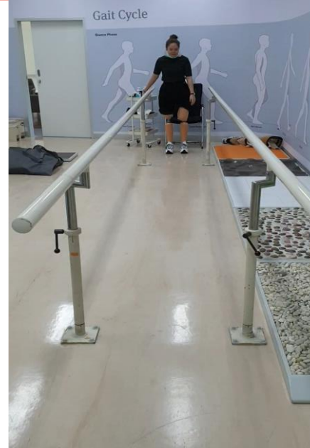
วิดีโอด้านหน้าขณะเดินบนพื้นระนาบแบบปล่อยมือ