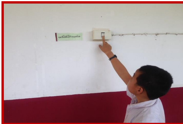
ภาพการเรียนการสอนเรื่อง ไฟฟ้า ของโรงเรียน ตชด. ชั้นตติยียะอุย จ. เชียงราย