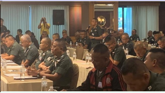
ครูใหญ่ ตชด. แลกเปลี่ยนเรียนรู้ระหว่างกัน