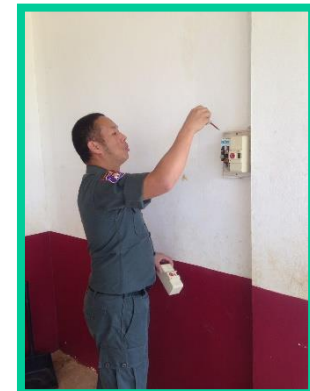
ภาพคณะทำงานความปลอดภัยของระบบไฟฟ้าในโรงเรียน ตชด. ชนิดปียะอุย จ. เชียงราย ประชุมคณะกรรมการและตรวจวัดอุปกรณ์ไฟฟ้าภายในโรงเรียน