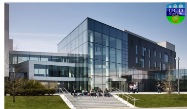
สถิติ ตั้งแต่ปี 2554-63 มีนักศึกษาทั้งหมด 6 รุ่น รวม 13 คน - สำเร็จการศึกษาแล้ว 9 คน - อยู่ระหว่างศึกษา 4 คน