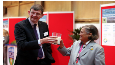
สมเด็จพระกนิษฐาธิราชเจ้า กรมสมเด็จพระเทพรัตนราชสุดาฯ สยามบรมราชกุมารี เสด็จพระราชดำเนินทอดพระเนตรฟาร์มวิจัยปศุสัตว์โลออนส์ มหาวิทยาลัยคอลเลจดับลิน เมื่อวันที่ 7 ก.ย. 57

การประชุมคณะกรรมการมูลนิธิเทคโนโลยีสารสนเทศตามพระราชดำริ สมเด็จพระเทพรัตนราชสุดาฯ สยามบรมราชกุมารี วันที่ ๕ มีนาคม ๒๕๖๔