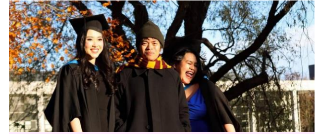
พิธีรับปริญญาเดือนธันวาคม 2564