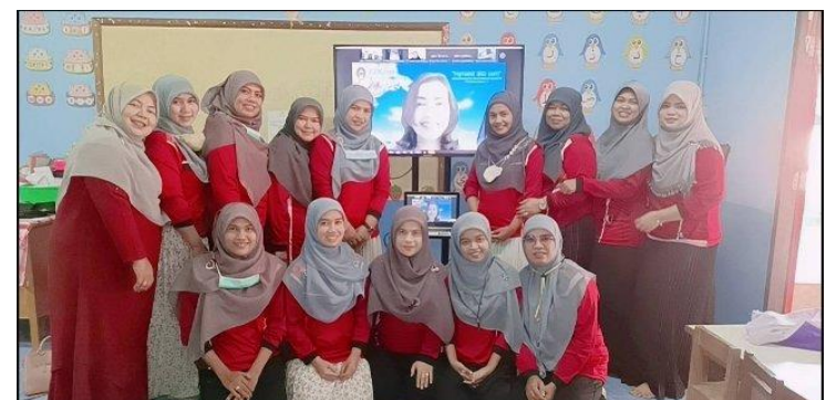
ภาพกิจกรรมการอบรม