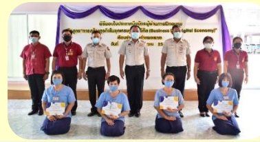
เรือนจำกลางกำแพงเพชร