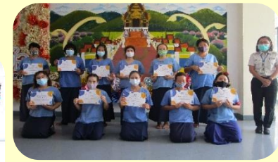
ทัณฑสถานหญิงเชียงใหม่