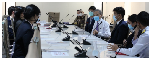
การประชุมนิเทศนักศึกษา ปี 2563 เมื่อ 17 ส.ค. 63 ณ สวทช.