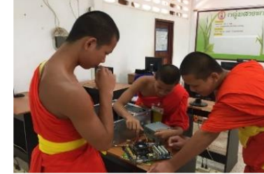
โรงเรียนเกียรติแก้ววิทยา