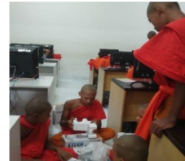
สวนใหญ่วิทยา