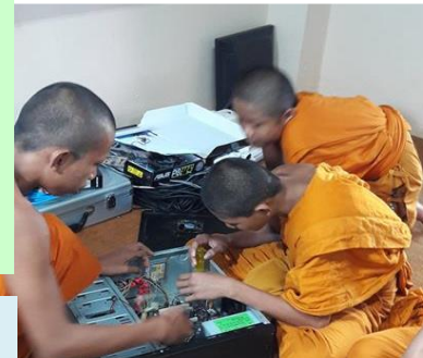
โรงเรียนศรีสะเกษวิทยา