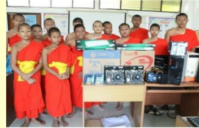
โรงเรียนโพธิ์ศรีวิทยา