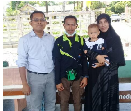
นายอำเภอจรัสย์ คอยดูแลการเดินทางไป กทม. ของ ด.ช.อัลฟรกรณและบิดามารดา