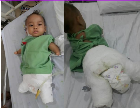
28 พ.ค.2561 ผ่าตัดแก้ไขการยึดติดข้อสะโพกกับ นพ.วีระศักดิ์ ธรรมคุณานนท์