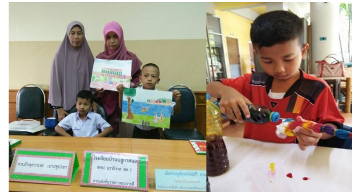
แข่งขันวาดรูปและทำกิจกรรมมด்ய่อม