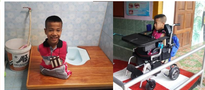
จัดทางลาดและปรับห้องน้ำในโรงเรียน