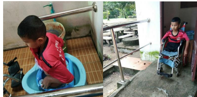
จัดทางลาดและปรับห้องน้ำในโรงเรียน