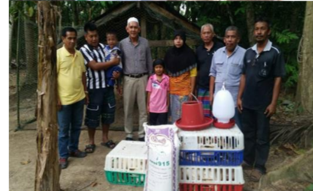
เลี้ยงปลาดุกเลี้ยงไก่ไข่และเปิด