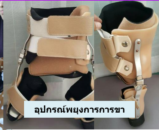
อุปกรณ์พยุงการการขา

เข้ารับการถอดเฝือกและทำกายภาพบำบัดเพื่อเคลื่อนในหัวข้อสะโพกและเพิ่มความแข็งแรงกล้ามเนื้อสถาบันสิรินธรฯ ช่วยจัดทำอุปกรณ์พยุงการทางขาเพื่อประคองไม่ให้ข้อสะโพกเคลื่อน