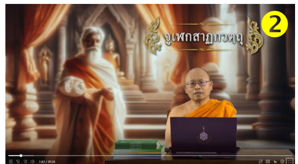
อธิบายเนื้อหาภาพรวม