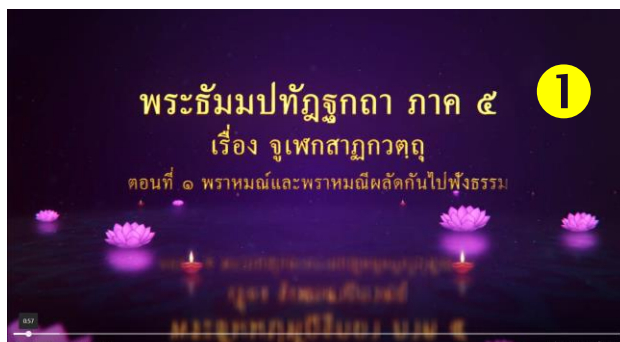
Title ของบทเรียน