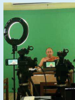
การถ่ายทำวิดีโอ Demo ที่วัดโมลีโลกยาราม