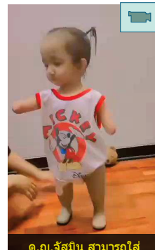
ด.ญ.จัสมีน สามารถใส่ขาเทียมยืนด้วยตนเองได้