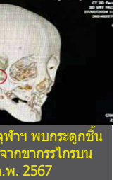
ตรวจติดตามที่ รพ.จุฬาฯ พบกระดูกขึ้นใหม่ทั้งออกออกมาจากขากรรไกรบน วันที่ 27 ก.พ. 2567