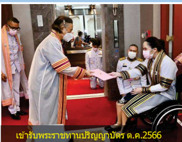
เข้ารับพระราชทานปริญญาบัตร ต.ค.2566