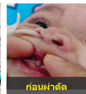
ก่อนผ่าตัด