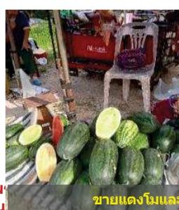
ขายแดงโมและปลาตกแดดเดียว