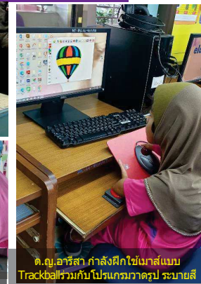
ด.ญ.อารีสา ร่วมกิจกรรมการเรียนรู้ที่โรงเรียนได้เป็นอย่างดี