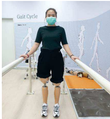
ขาเทียมใหม่ C-Leg รุ่น 4