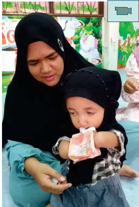
ด.ญ.จัสมีน สามารถทานอาหารและเครื่องดื่มทางปากด้วยตนเอง