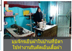
นมจักรเย็บผ้าในบ้านที่บิดาใช้ทำงานรับผิดชอบเสื้อผ้า