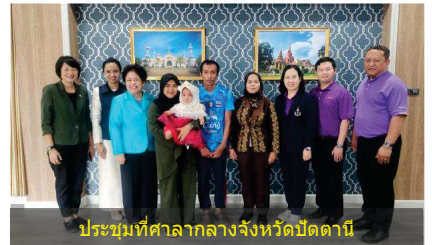
ประชุมที่ศาลากลางจังหวัดปัตตานี