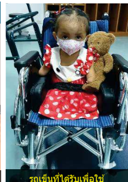
รถเข็นที่ได้รับเพื่อใช้ในการเดินทาง