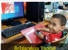
ฝึกใช้กลิ้งแบบ Trackball