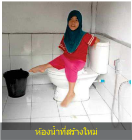
ห้องน้ำที่สร้างใหม่