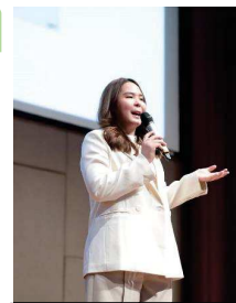
วิทยากรบรรยายและร่วมประชุมในเวทีแลกเปลี่ยนความคิดเห็น