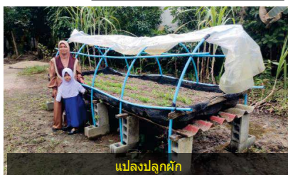
แปลงปลูกผัก