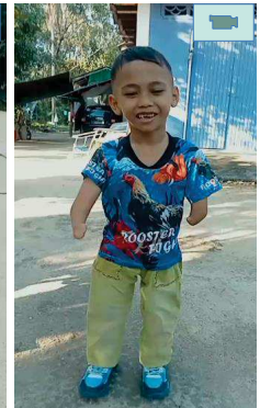
ด.ช.อัลฟรกรณ สามารถใส่ขาเทียมยืนด้วยตนเองได้