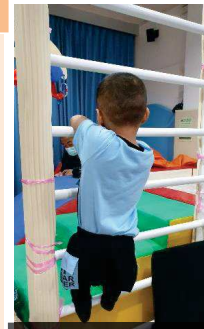
ด.ช.อัลฟรกรณ สามารถปีนขึ้นลงที่ต่างระดับได้