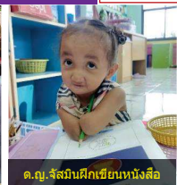
ด.ญ.จัสมีนฝึกเขียนหนังสือ