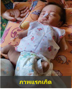
ภาพแรกเกิด