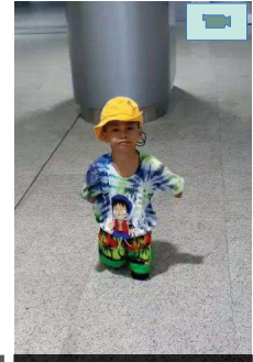
ด.ช.อัลฟรกรณ สามารถเดินตัวเปล่าได้ดีขึ้น