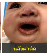
หลังผ่าตัด