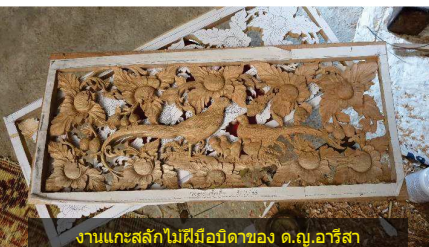
งานแกะสลักไม้ฝีมือบิดาของ ด.ญ.อารีสา