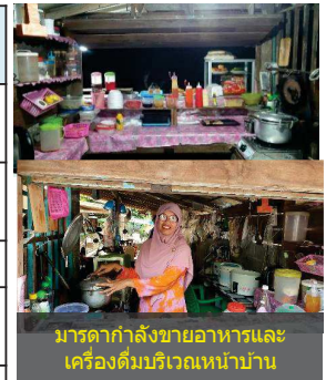
มารดากำลังขายอาหารและเครื่องดื่มบริเวณหน้าบ้าน

การสนับสนุนอื่น ๆ มูลนิธิคนพุ่มมอบทุนการศึกษา 5,000 บาท/ปี เกษตร อ.ยิ่งอ มอบเมล็ดพันธุ์ผักมาให้ปลูกสำนักงานประมง อ.ยิ่งอ ทำบ่อเลี้ยงปลาตกและมอบพันธุ์ปลาตกให้ 200 ตัว เพื่อเลี้ยงเป็นอาหารลดค่าใช้จ่าย