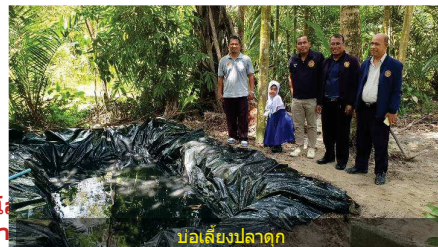
บ่อเลี้ยงปลาตก