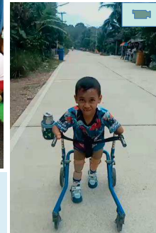
ด.ช.อัลฟรกรณ สามารถใส่ขาเทียมเดินร่วมกับเครื่องช่วยเดินแบบมีล้อ