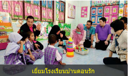
เยี่ยมโรงเรียนบ้านดอนรัก