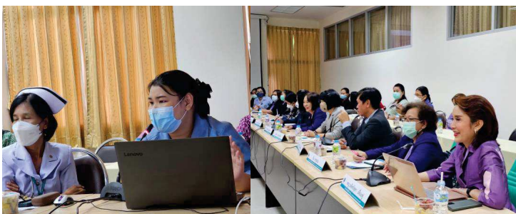
ภาพนิเทศและตรวจเยี่ยม รพ.เครือข่าย

ผล: จากการนิเทศติดตามงานพบว่า หน่วยงานในพื้นที่ ได้แก่ สพพ. สพฉ. และ สกร. บางจังหวัด ไม่ทราบการดำเนินงานโครงการฯ จึงขาดการประสานงานการส่งต่อการศึกษาของเด็กป่วย ซึ่งแต่ละหน่วยงานเห็นประโยชน์ของโครงการฯ และยินดีสนับสนุนการดำเนินงาน โดยคณะนิเทศวางแผนจัดประชุมให้ข้อมูลการดำเนินงานแก่หน่วยงานเครือข่ายต่อไป