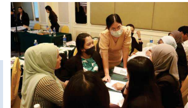
ระดมความคิดเห็นแลกเปลี่ยนเรียนรู้