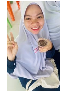
โรงเรียนธรรมพิทยาคาร : โครงการทำขนมเบเกอรี่ แปรรูปผลิตภัณฑ์จากต้นโกโก้