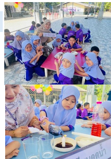
ตัวอย่างครูจัดกิจกรรมให้กับนักเรียนปฐมวัยโรงเรียนพระยานาวินคลองหินวิทยา