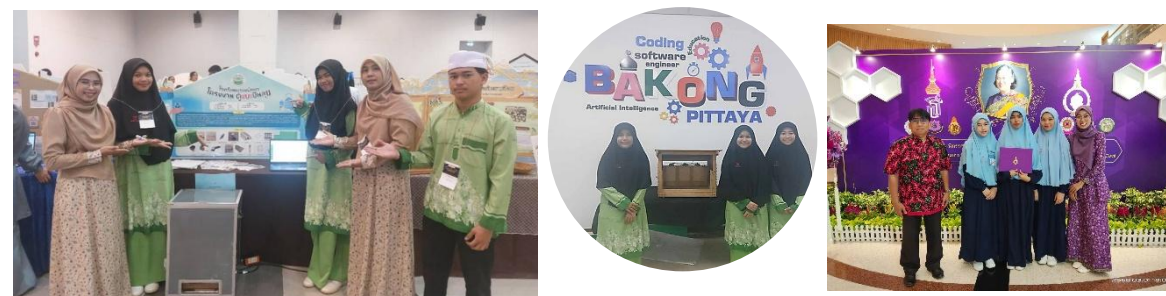
โรงเรียนบางกอกพิทยาศาสตร์ : ดำเนินงานห้องโค้ดดิ้ง นักเรียนชนะเลิศการแข่งขันประกวดโครงงาน