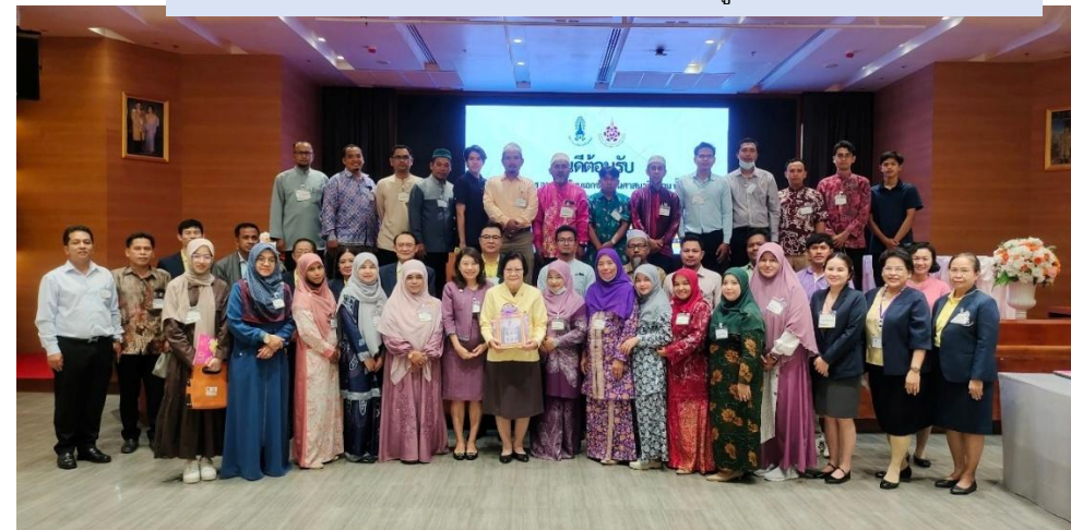
ภาพกิจกรรมการศึกษาดูงาน