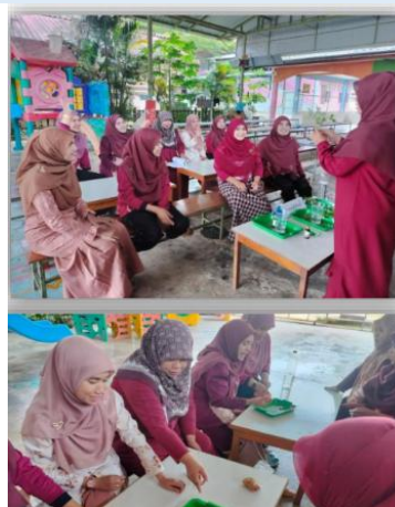
ตัวอย่างการอบรมขยายผลของโรงเรียนส่งเสริมอิสลาม