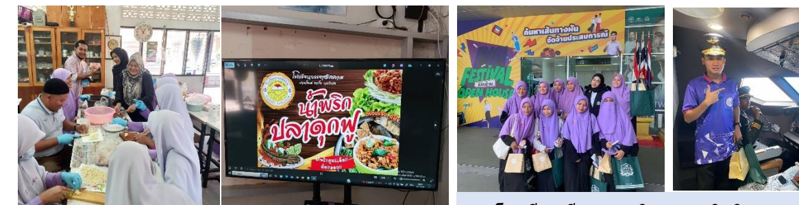
โรงเรียนจรรยาอิสลาม : แปรรูปปลาดุกฟู