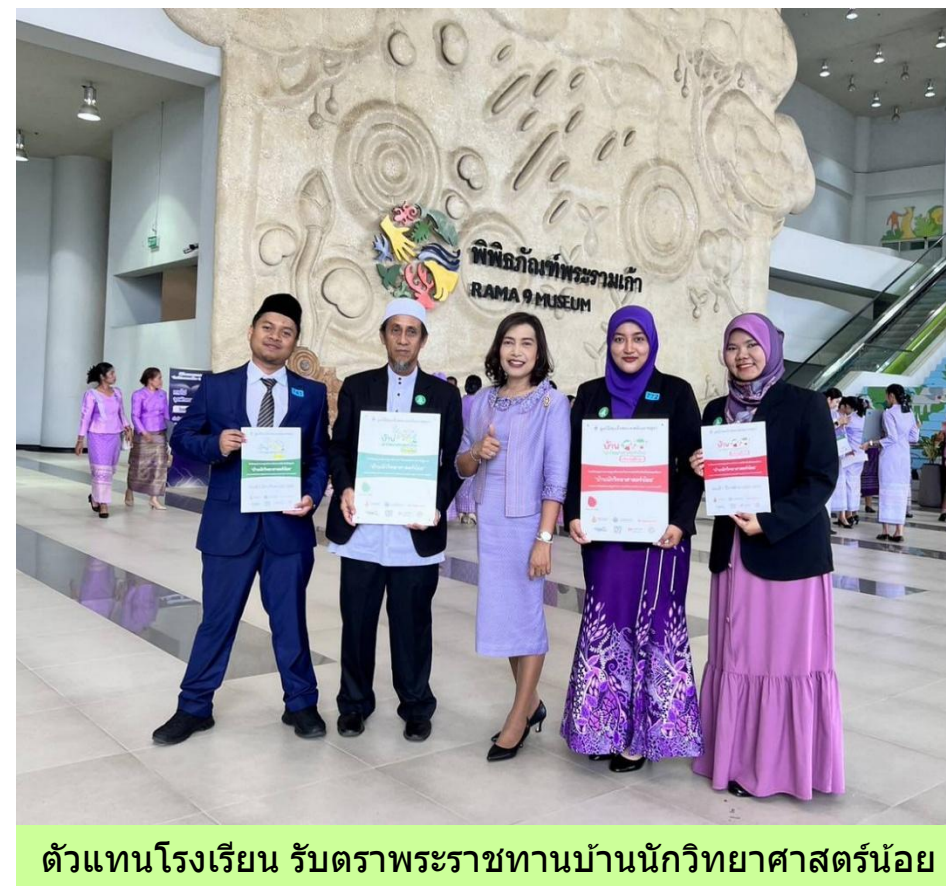
ตัวแทนโรงเรียน รับตราพระราชทานบ้านนักวิทยาศาสตร์น้อย

จำนวน 1 แห่ง ได้แก่ โรงเรียนส่งเสริมอิสลาม จ.สงขลา