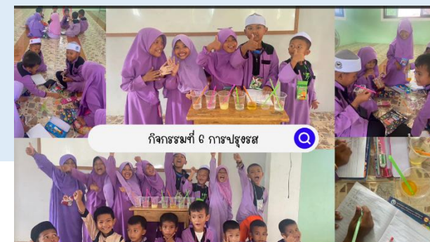
กิจกรรมที่ 6 การปฐุจธส