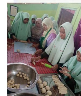
โรงเรียนสมานมิตรวิทยา : โครงการเสริมสร้างอาชีพขนมพื้นบ้าน