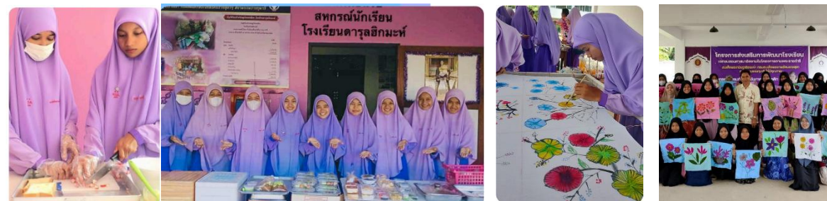
โรงเรียนดารุลฮิกมะห์ : นักเรียนแปรรูปอาหารและทำผ้าบาติก