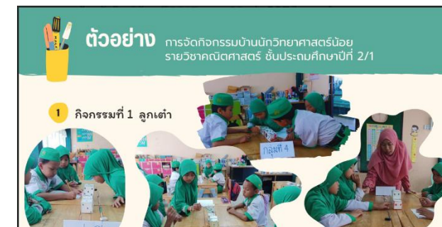
ตัวอย่าง

การจัดกิจกรรมบ้านนักวิทยาศาสตร์น้อย รายวิชาคณิตศาสตร์ ชั้นประถมศึกษาปีที่ 2/1