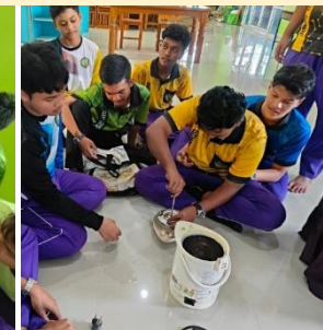
โรงเรียนส่งเสริมอิสลาม : กิจกรรมช่างซ่อมเครื่องใช้ไฟฟ้าภายในบ้าน