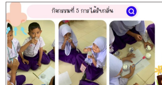
ตัวอย่างการจัดกิจกรรมให้กับนักเรียนชั้นประถมศึกษา รร.ธรรมพิทยาคาร