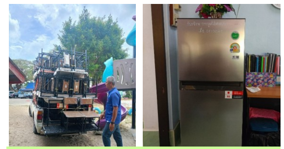
โรงเรียนบ้านดอนรัก ได้รับการสนับสนุน โต๊ะเก้าอี้นักเรียน ตู้เย็น และอุปกรณ์