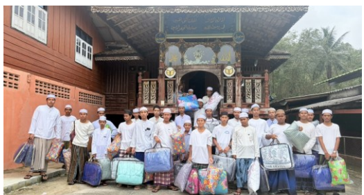
โรงเรียนบ้านกุวิง ได้รับการสนับสนุนที่นอน