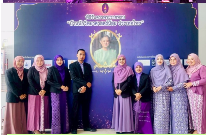
คณะครูเข้าร่วมพิธีรับตราพระราชทานฯ

การประชุมคณะกรรมการมูลนิธิเทคโนโลยีสารสนเทศตามพระราชดำริสมเด็จพระเทพรัตนราชสุดาฯ สยามบรมราชกุมารี วันที่ 23 มีนาคม 2569