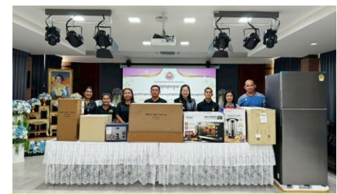
โรงเรียนโสตศึกษาจังหวัดสงขลา ได้รับการสนับสนุนอุปกรณ์ฝึกอาชีพร้านค้าแพ