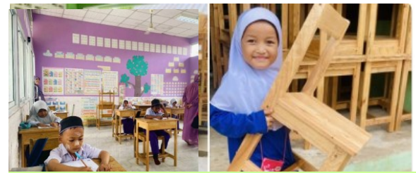
โรงเรียนธรรมพิทยาคาร ได้รับการสนับสนุน โต๊ะครู และ โต๊ะ-เก้าอี้นักเรียนระดับประถมศึกษา

หมายเหตุ: โรงเรียนลำดับที่ 3 และ 4 อยู่ในโครงการเทคโนโลยีสารสนเทศเพื่อคนพิการ