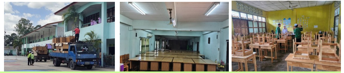
โรงเรียนभागพิทยาได้รับการสนับสนุนโต๊ะครู และ โต๊ะ-เก้าอี้นักเรียนระดับประถมศึกษา