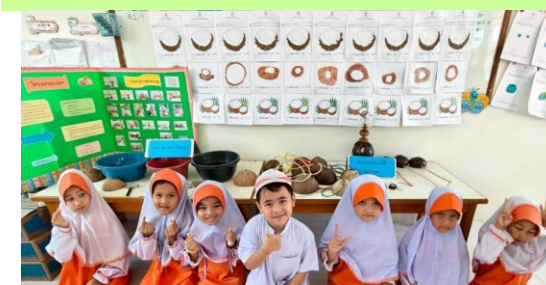
โรงเรียนส่งเสริมอิสลามจัดนิทรรศการโครงการบ้านนักวิทยาศาสตร์น้อย