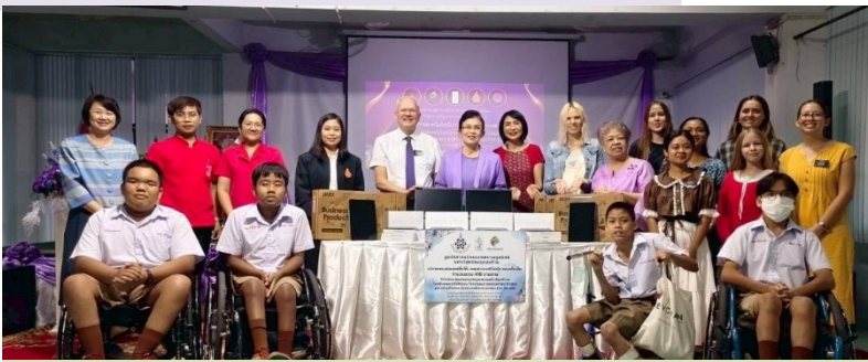
วันที่ 24 กันยายน 2568 กลุ่มโรงเรียน ณ โสດศึกษาจังหวัดนนทบุรี จ.นนทบุรี