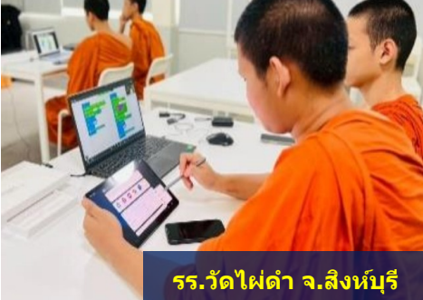
รร.วัดไผ่ดำ จ.สิงห์บุรี