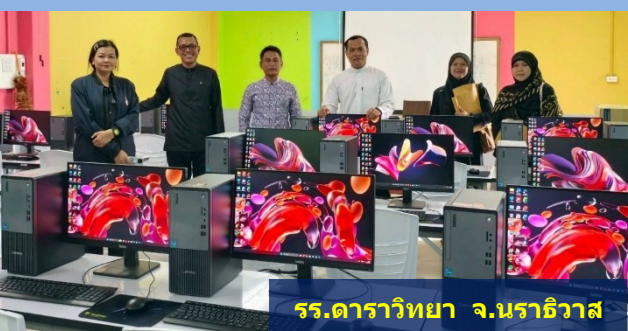
รร.ดาราวิทยา จ.นราธิวาส