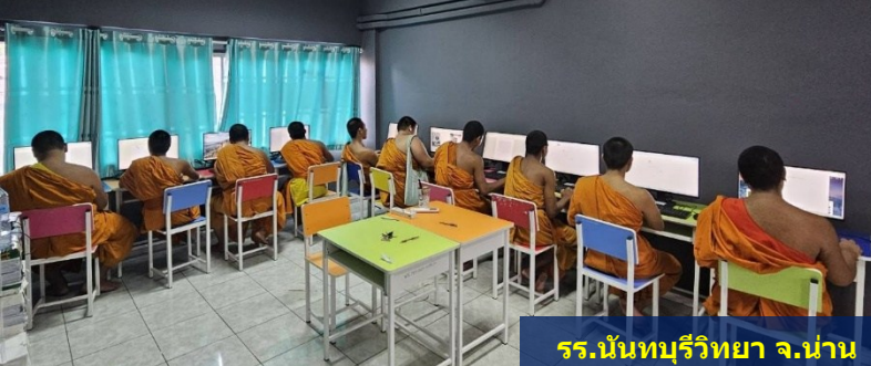
รร.บ้านทูลกระหม่อม จ.ปทุมธานี