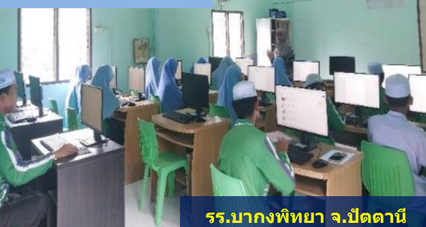
รร.บางกอกพิทยา จ.ปัตตานี