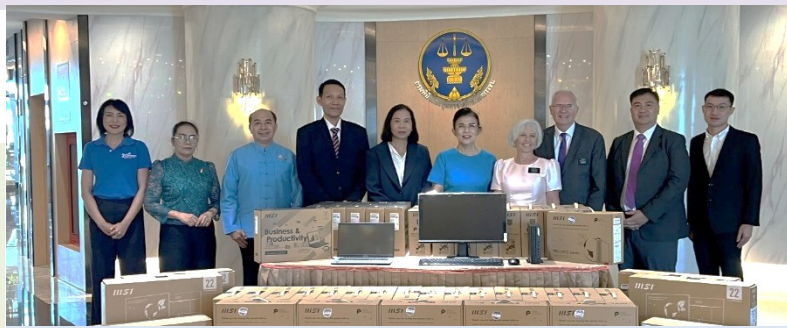
วันที่ 5 กันยายน 2568 กลุ่มสภาพินิจ ณ กรมพินิจและคุ้มครองเด็กและเยาวชน