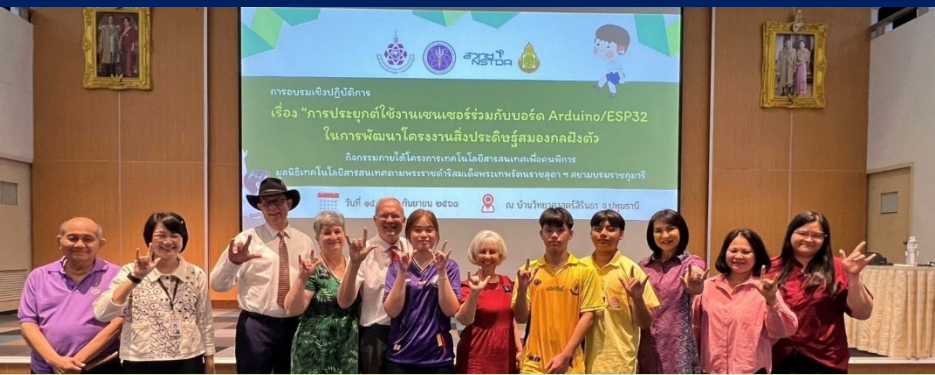
วันที่ 15 – 17 ก.ย. 2568 เยี่ยมชมการอบรมเชิงปฏิบัติการเรื่อง "การประยุกต์ใช้งานเซนเซอร์ร่วมกับบอร์ด Arduino/ESP32 ในการพัฒนาโครงงานสิ่งประดิษฐ์สมองกลฝังตัว" ณ ห้องประชุมออดิทอเรียม จ.ปทุมธานี